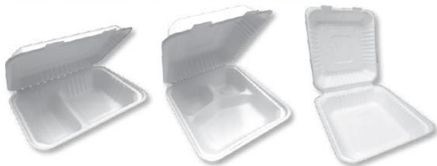
Opakowania na wynos - Eko trzcina