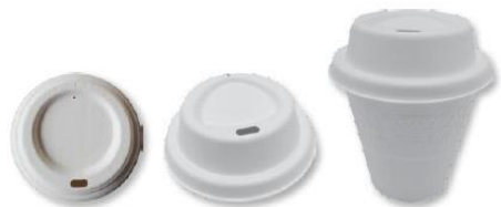
Kubki i wieczka - Eko trzcina